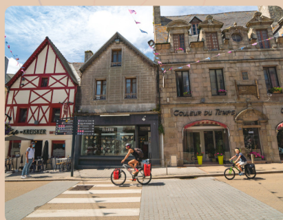
Saint Pol de Léon