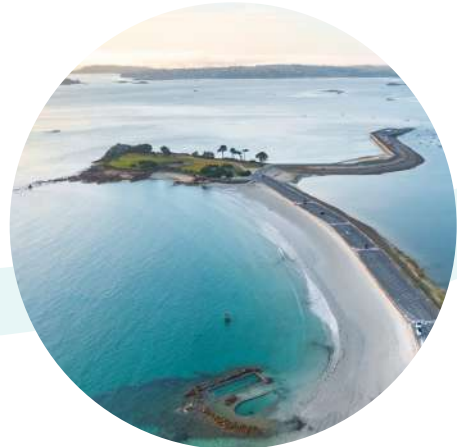
Plage Sainte-Anne Saint-Pol-de-Léon