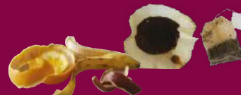
RESTES ALIMENTAIRES (ou dans le composteur)