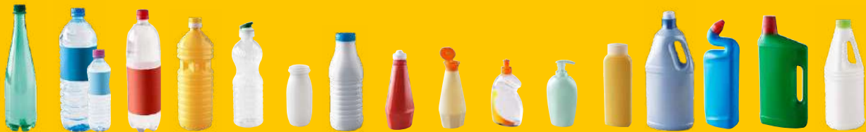
EMBALLAGES EN PLASTIQUE : BOUTEILLES ET FLACONS