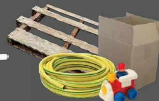
GROS OBJETS BOIS ET CARTONS

PLUS D'INFORMATIONS SUR www.hautleoncommunaute.bzh