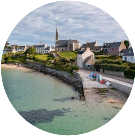
"Le Débarcadère" Ile de Batz