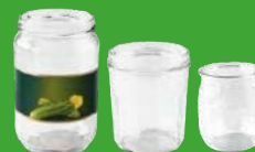
POTS ET BOCAUX EN VERRE sans le couvercle