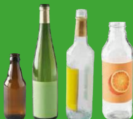
BOUEILLES EN VERRE sans le bouchon