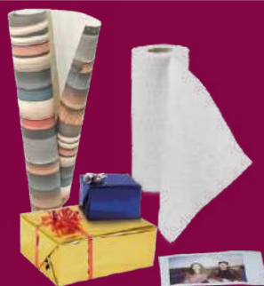
PAPIERS NON RECYCLABLES