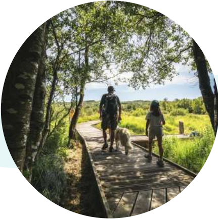
Lac du Drenec Commana