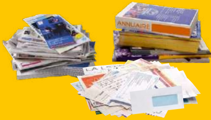
PAPIERS, MAGAZINES ...