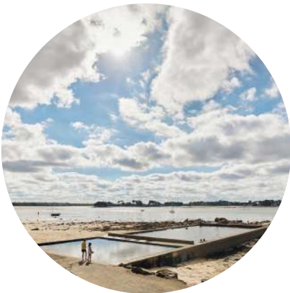
Plage de Rockroum Roscoff