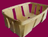
EMBALLAGES EN BOIS

sac de 50 litres maximum pour les dépôts en borne