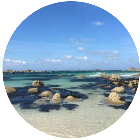
Plage des Amiets Cléder