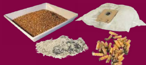
MÉGOTS, LITIÈRES, CENDRES, POUSSIÈRES